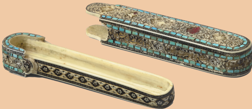
Plumier au nom de Shah Abbas Inde, Deccan, début du XVII e siècle Ivoire de morse, or, turquoise, pâte noire, soie Paris, musée du Louvre, département des Arts de l'Islam