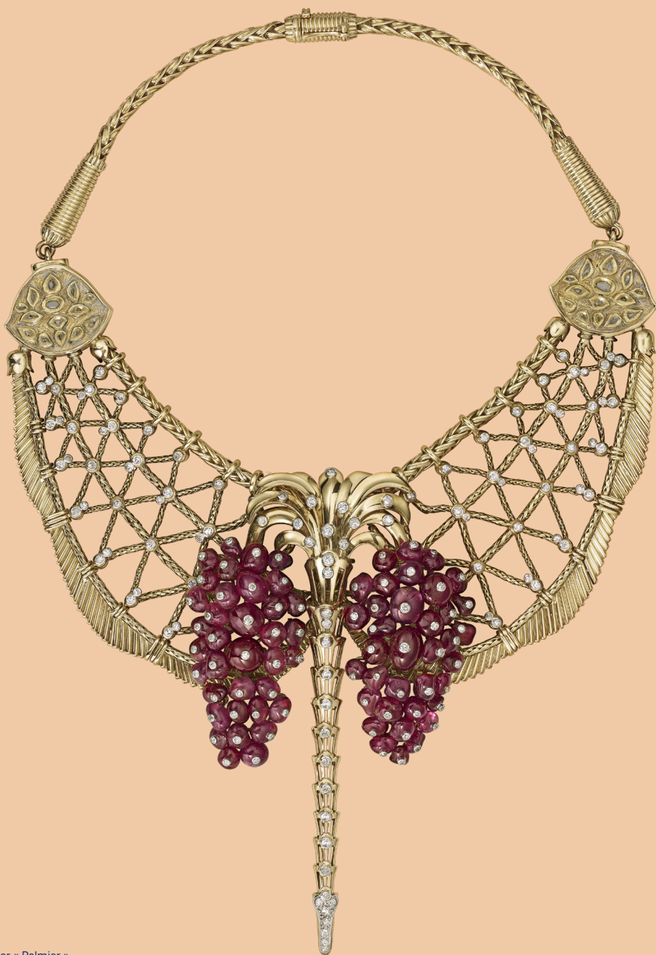
Collier « Palmier » Cartier Paris, 1949 Or, platine, diamant, rubis