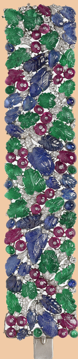
Bracelet Tutti Frutti Cartier Paris, 1929 Platine, diamant, rubis, saphir, émeraude Collection Cartier