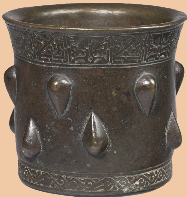
Mortier Iran, XI e -XII e siècles Bronze, fonte de cuivre, fonte à la cire perdue Paris, musée du Louvre, département des Arts de l'Islam Dépôt du musée des Arts décoratifs