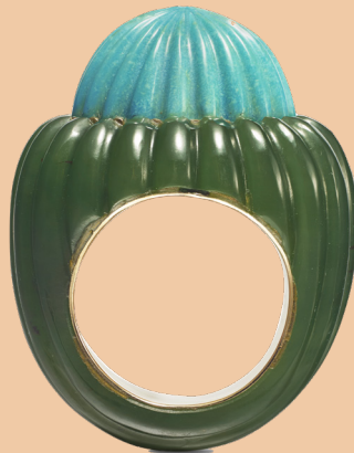
Bague «Dôme» Cartier New York, 1968 Or, jade, turquoise Collection Cartier