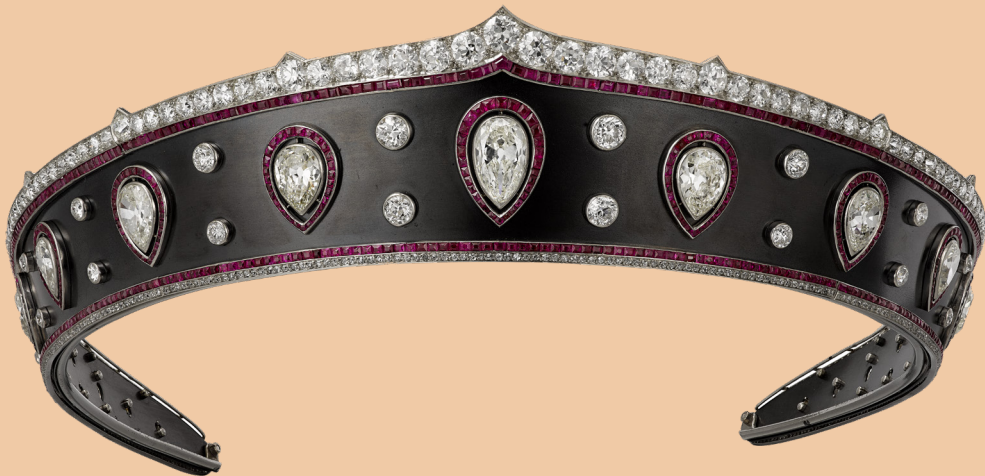
Diadème Cartier Paris, 1914 Platine, acier, diamant, rubis