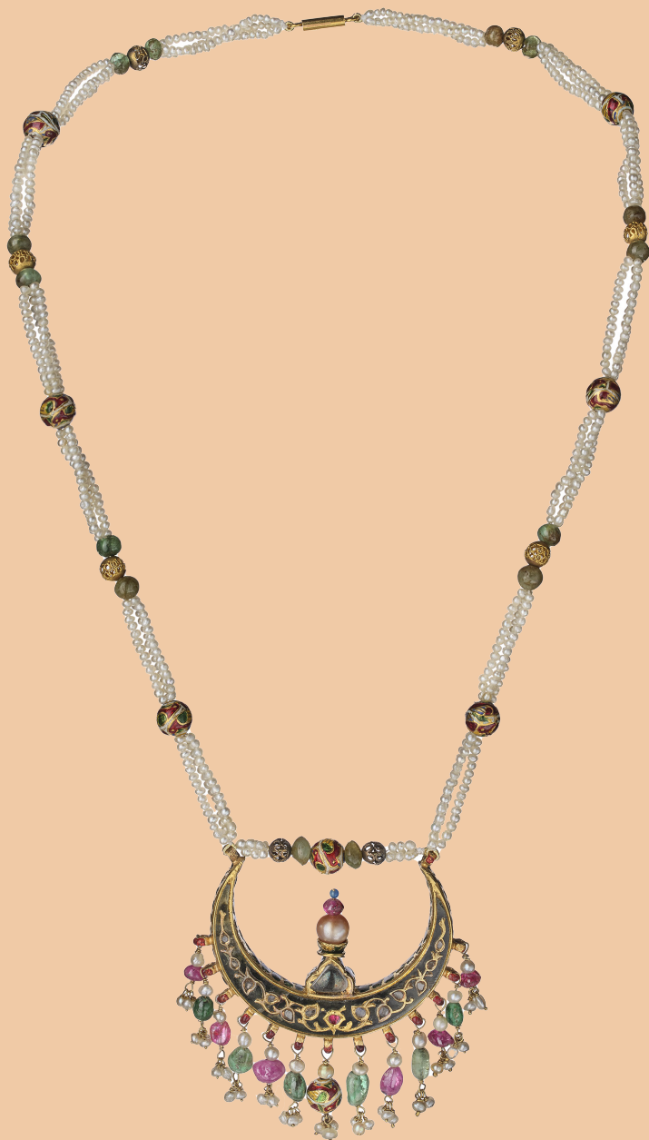
Collier présenté lors de l'exposition de 1913 chez Cartier à Paris, cat. n° 12 Inde, XVIII e -XIX e siècles, Cartier Paris, 1913 Or, cristal de roche fumé, émeraude, rubis, jade, perle, émail Paris, musée des Arts décoratifs