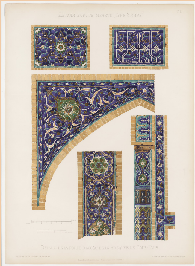
Les mosquées de Samarcande - Fascicule 1 Détails de la porte d'accès de la mosquée Gour Emir Saint-Petersburg, Imperial archaeological commission, 1905 Paris, Archives Cartier © Collection Cartier