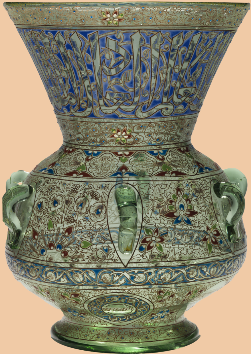
Lampe dite de mosquée Philippe-Joseph Brocard, Paris, 1871 Verre soufflé et émaillée Abu Dhabi, Louvre Abu Dhabi