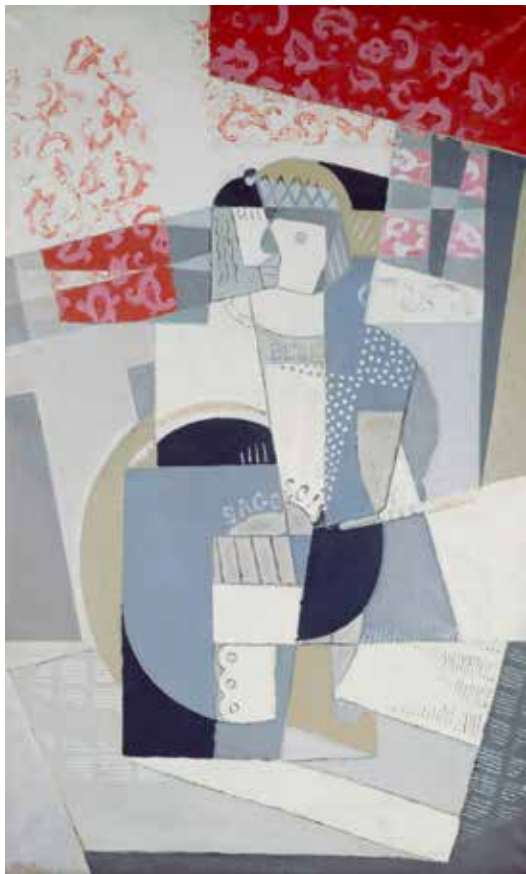
L'ENFANT AU CERCEAU Maria Blanchard France, 1917 Huile sur toile Centre Georges Pompidou