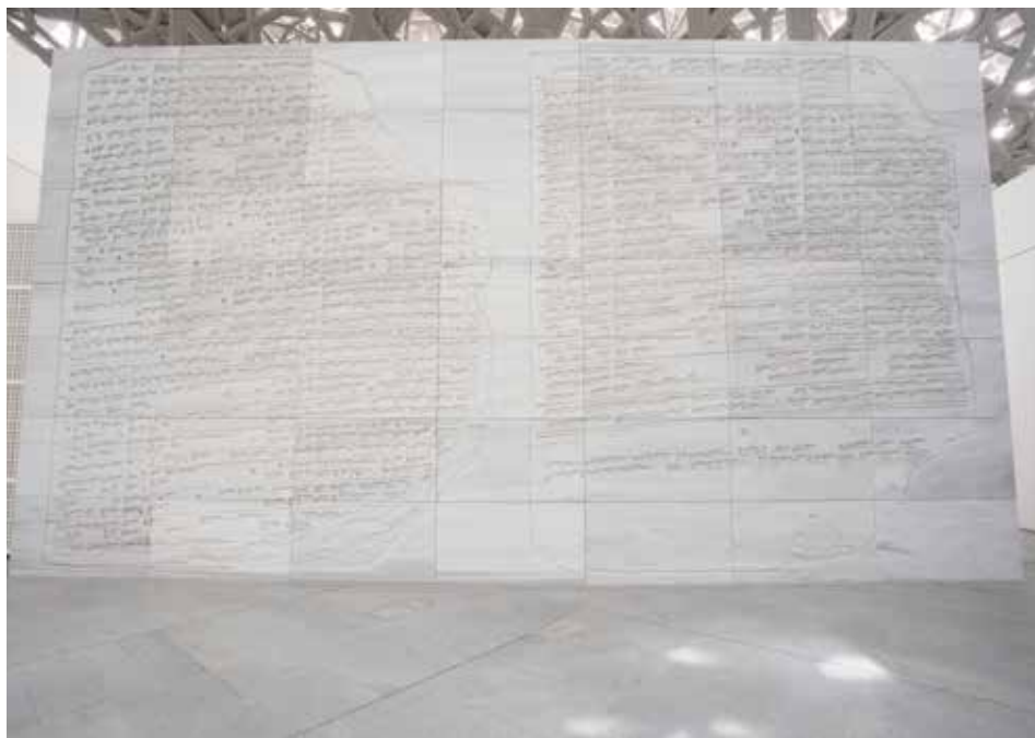
©2017 Jenny Holzer, member Artists Rights Society (ARS)